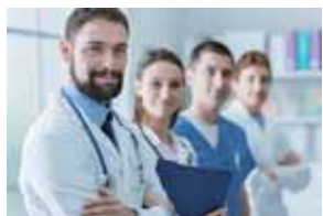
イノベーション創出アプローチ “バイオデザイン”