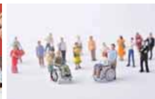
超高齢社会における ヘルスケアシステム・ビジネス