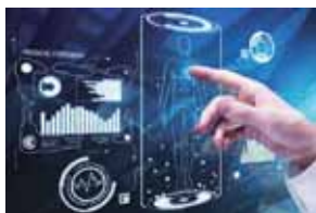
デジタルヘルス (IoT、ウェアラブル、AR/VR、ロボティクス、AI)