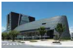
日米の医療機器ビジネスの 専門家が静岡に集結