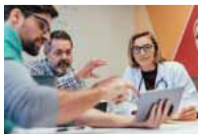
開発・事業化 支援制度、機関